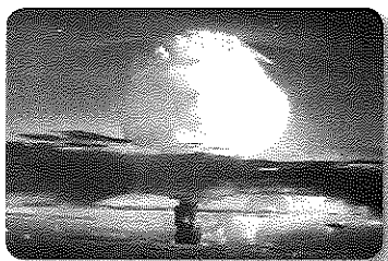
Prueba nuclear de Estados Unidos en 1957.